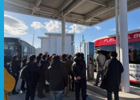
▲県外施設見学の様子