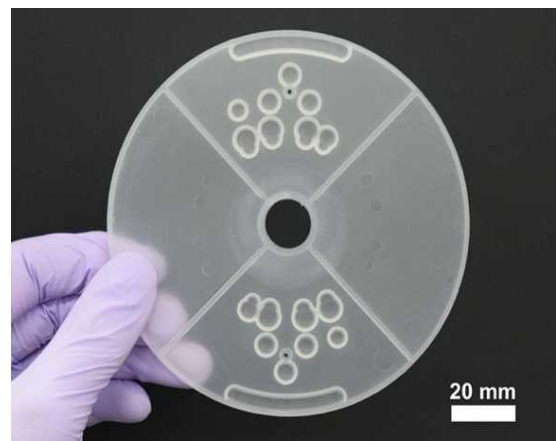
図2 試作したマイクロ流体デバイス

現に目処が立ったと言えます。本成果では、射出成形によって試作したマイクロデバイス(図2)が酵素免疫測定法 (用語3) による抗原測定を実行(図3)できることを示した成果であり、小型で安価(数万円程度)な血液検査装置の実現に向けた大きな成果であると言えます。