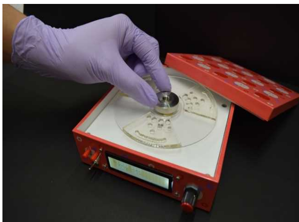
図1 開発した検査装置の外観写真

本成果は、本研究グループが開発したマイクロ流体デバイスの制御技術であるCLOCK (用語2) の原理を採用することで、マイクロ流体デバイスの制御機構の大幅な簡略化を達成し、検査装置の中枢部がお弁当箱に入るほどの小型化に成功したものです(図1)。また、CLOCKの原理に基づくマイクロデバイスでは、他のマイクロ流体デバイスで使用されるマイクロバルブやマイクロポンプなどの動く微細機構の作り込みが必要ないため、プラスチックの射出成形等一般的な技術によって製造可能なことも大きな強みと言え、このことから1チップ数百円以下の低廉化の実