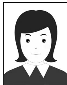
【適切な顔写真の例】

3ヶ月以内に撮影した正面上半身、脱帽、無背景、フルカラー、縦4：横3(縦800ピクセル×横600ピクセル以上)、JPEG形式の写真を用意してください。