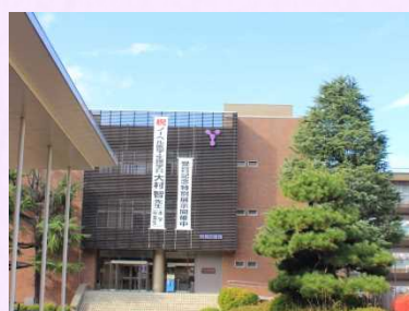
特別展開催会場（附属図書館）